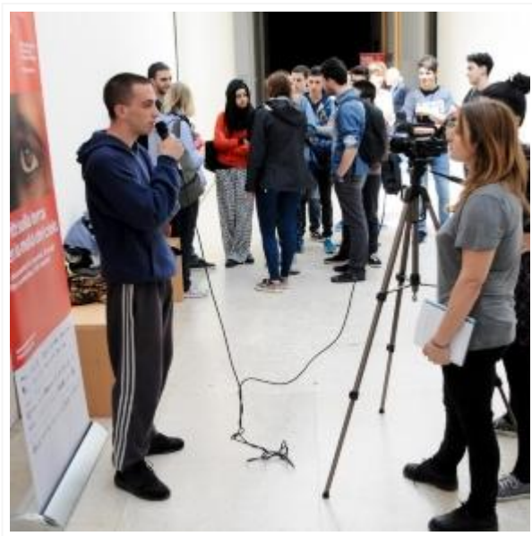
Libera la parola», il contest sui diritti umani per le scuole ... - emmaonline.it

Il Festival dei Diritti Umani, Fnsi e Miur propongono il concorso 'Libera la parola' aperto a tutti gli studenti delle scuole superiori.