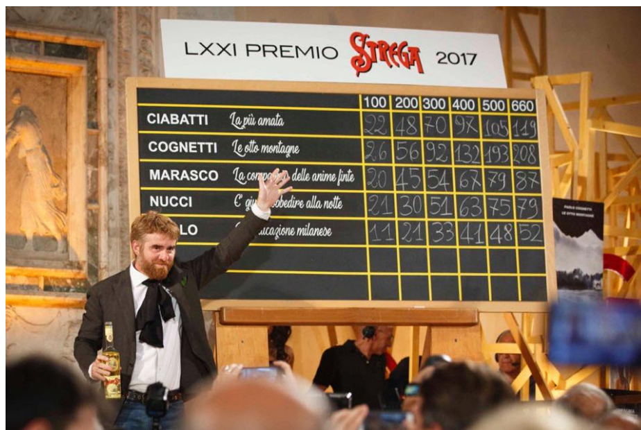
Paolo Cognetti vince il Premio Strega 2017 con il libro Le otto montagne