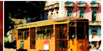
Milano in tram