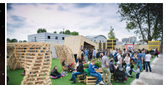
Market Sound, Milano – Eventi a...