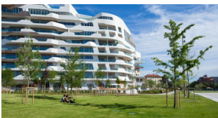
Parco City Life, Milano – Eventi a...