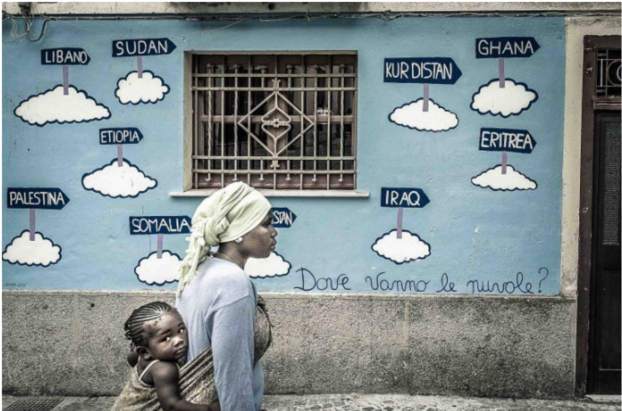
Dal 2 al 7 maggio a Milano il Festival dei Diritti Umani. Immagine: "Dove vanno le nuvole?" di Massimo Ferrari (2017)

Il Festival dei Diritti Umani , nella sua seconda edizione, vuole attirare l'attenzione sulla libertà d'espressione, sapendo che si tratta di un problema articolato, sempre più grave, come dimostrano le chiusure di giornali e le incarcerazioni di giornalisti, i vincoli imposti agli artisti e le abiure chieste agli scrittori, i limiti sollecitati per il web e i social network, accusati di fomentare odio e bullismo. In troppe nazioni manca totalmente o parzialmente il diritto a pensare, a parlare, a comunicare. È un diritto fondamentale perché comprende la possibilità di esprimersi senza essere censurati o addirittura rischiare la vita; la libertà di essere pienamente se stessi, rivendicando le proprie idee, convinzioni o stili di vita.