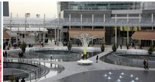
Piazza Gae Aulenti, Milano – Eventi a...