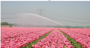
Alle porte di Milano nasce un grande...