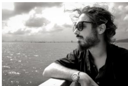
Il fotografo Stefano Stranges

In aggiunta alle mostre fotografiche, questa terza edizione del festival propone al pubblico incontri con autori e giornalisti che hanno trattato, con approfonditi reportage, problemi legati all'ecologia e ai cambiamenti climatici, le cui ripercussioni incrementano i rischi per il nostro pianeta.