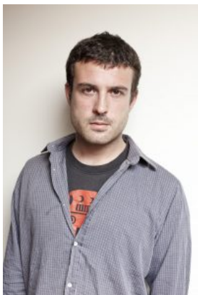
Il fotografo Andrea Kunkl

piombo, olii e amianto sono riversate quotidianamente in mare e sulla sabbia, andando a distruggere gli ecosistemi locali e la vita di pescatori, agricoltori e allevatori.