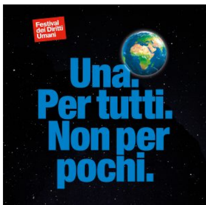
Il logo del Festival dei diritti umani 2018

La devastazione della Terra minaccia la salute, l’agricoltura, le risorse idriche, causa estinzioni e migrazioni. Dall’inquinamento ai profughi ambientali, passando per l’impazzimento climatico, fino ad arrivare ai primi segnali di consapevolezza della necessità di un’inversione di tendenza, le declinazioni del macro-tema di questa terza edizione del festival sono davvero tante.