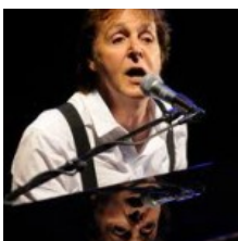
Londra: Paul McCartney a sorpresa a Covent Garden