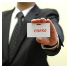
La libertà di stampa è in declino, peggiorate le cose in Italia