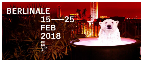
68 FESTIVAL DEL CINEMA DI BERLINO

Il Festival dei Diritti Umani di Milano ha deciso di celebrare il 70° anniversario della Dichiarazione dei Diritti dell'Uomo con un caleidoscopio di brevi film girati da importanti registi e artisti contemporanei. Nel corso della sua terza edizione – che si terrà alla Triennale di Milano dal 20 al 24 marzo – si potranno vedere i 22 “corti” che l'Alto Commissariato dei