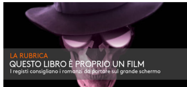
PRIMA PAGINA / QUESTO LIBRO È PROPRIO UN FILM