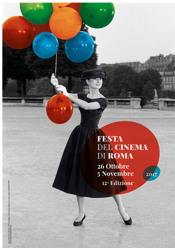
12 FESTA DEL CINEMA DI ROMA

Utilizziamo i cookie per la migliore esperienza sul nostro sito. Continuando la navigazione confermate il vostro consenso all'utilizzo dei cookie.