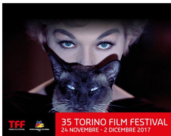
35 TORINO FILM FESTIVAL